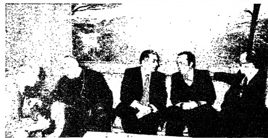
الرئيس سركيس لدى عودته وفي استقباله الرئيسان الاسعد والحس والسفر البازيبي وبيروت